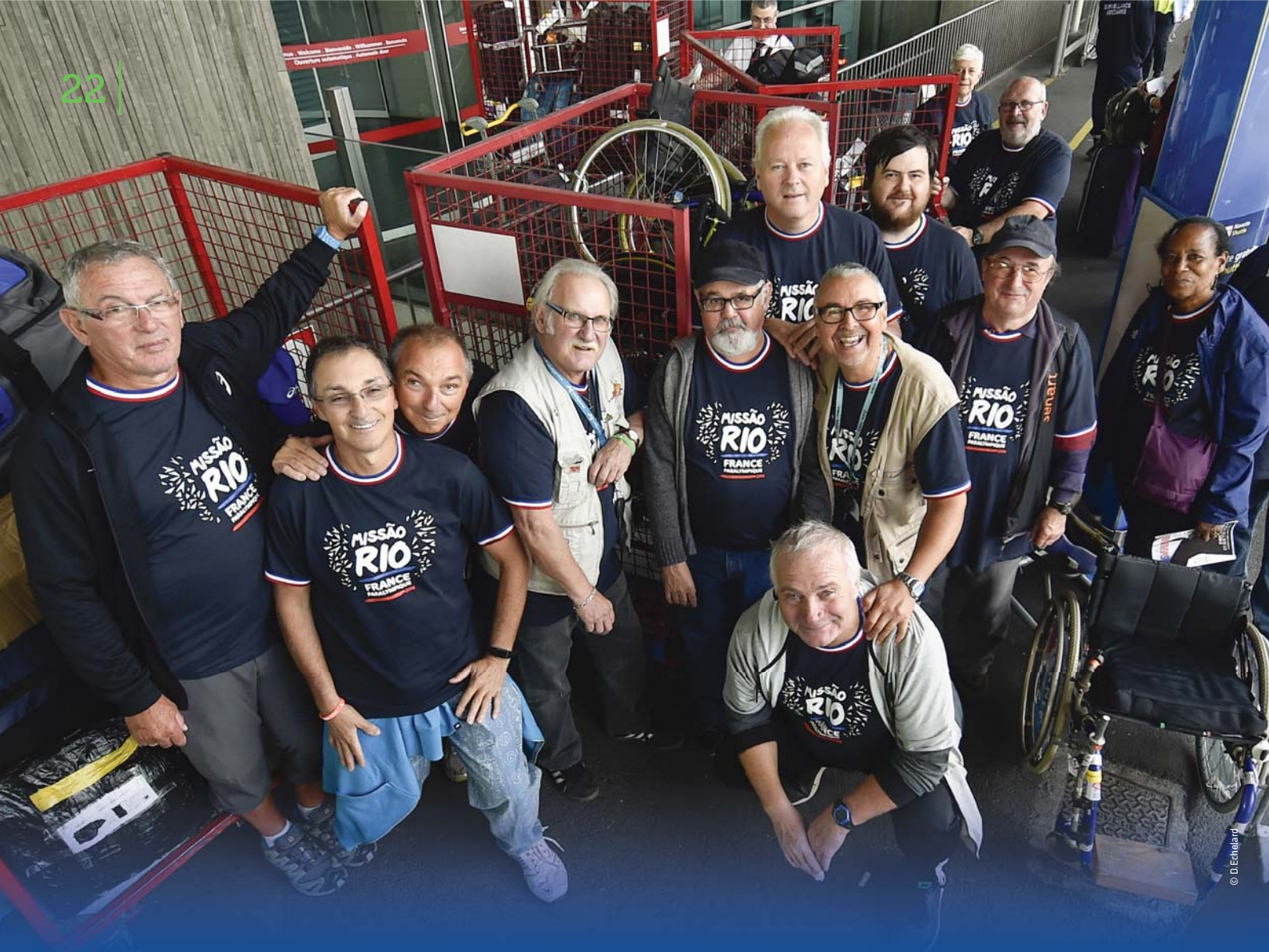
Aéroport Roissy Charles de Gaulle, 20 sept. 2016 : mission fret accomplie au retour de l'équipe de France paralympique des Jeux de Rio.