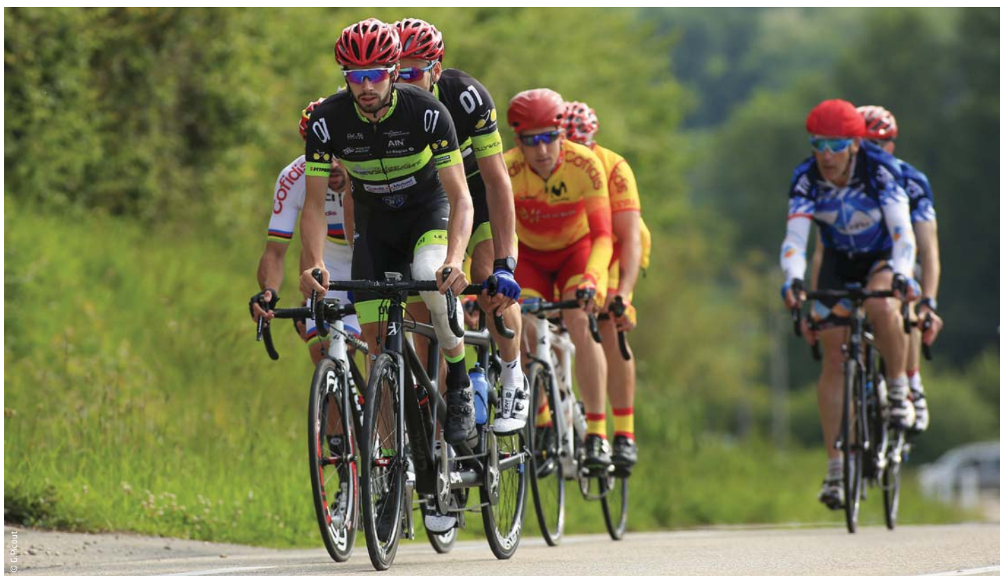
Handi Tour de l'Ain UCI, à Bourg-en-Bresse le 25 mai 2019

L'Agence Française de Lutte contre le Dopage (AFLD) est chargée de veiller au bon respect de l'éthique sportive, d'éduquer et de prévenir tous les sportifs, quel que soit leur niveau de pratique, des méfaits du dopage dans le sport. Ces missions de prévention et de suivi de l'AFLD concernent aussi les sportifs Handisport.