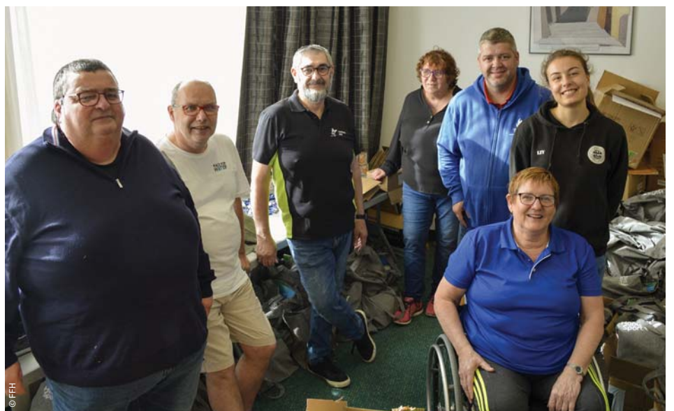
Avec plus de 500 participants sur les Journées Nationales Handisport organisées à La Chapelle-sur-Erdre (44) en avril dernier, il était indispensable pour le comité régional handisport des Pays de la Loire de pouvoir compter sur son réseau de bénévoles.