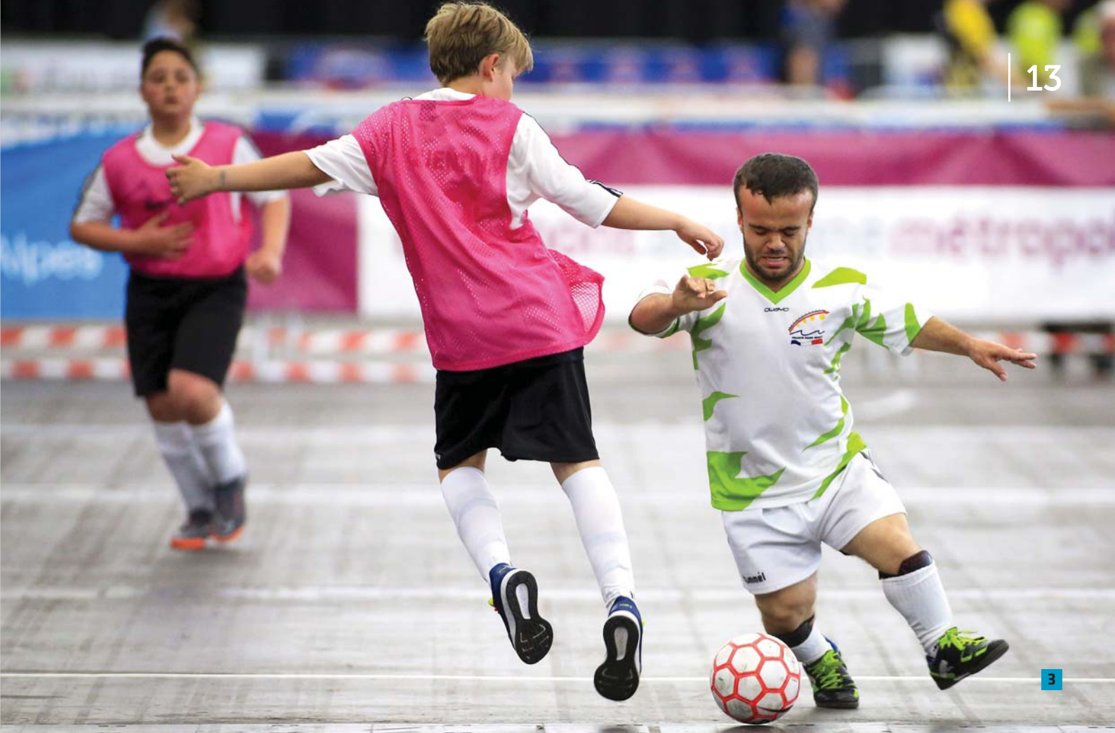
3. Les amoureux de football se sont retrouvés du 21 au 23 juin, pour la Coupe de France de Foot à 5 jeunes handisport, à Clermont Ferrand où plus de 120 joueurs étaient présents ! © G.Picout 4. Le 38 e championnat de France de sport-boules lyonnaises doubles a été organisé à Bourg-en-Bresse, du 25 au 26 mai. Félicitations à tous les compétiteurs ! © G.Picout