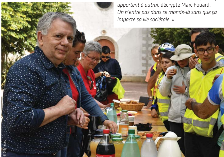
Accueil et convivialité sur le stand ravitaillement du Ré Tour 2019

Viellissement, mobilité accrue des jeunes, augmentation des tâches administratives... Le renouvellement de bénévoles se fait assez difficilement. Pour y parvenir, la FFH a recours à des associations comme le CVS ou France Bénévolat... Il existe aussi des mécénats d'entreprise : d'importantes sociétés libèrent des collaborateurs afin de les mettre à disposition du monde associatif. Il y a bien entendu les réseaux sociaux, le bouche-à-oreille et les circuits internes.