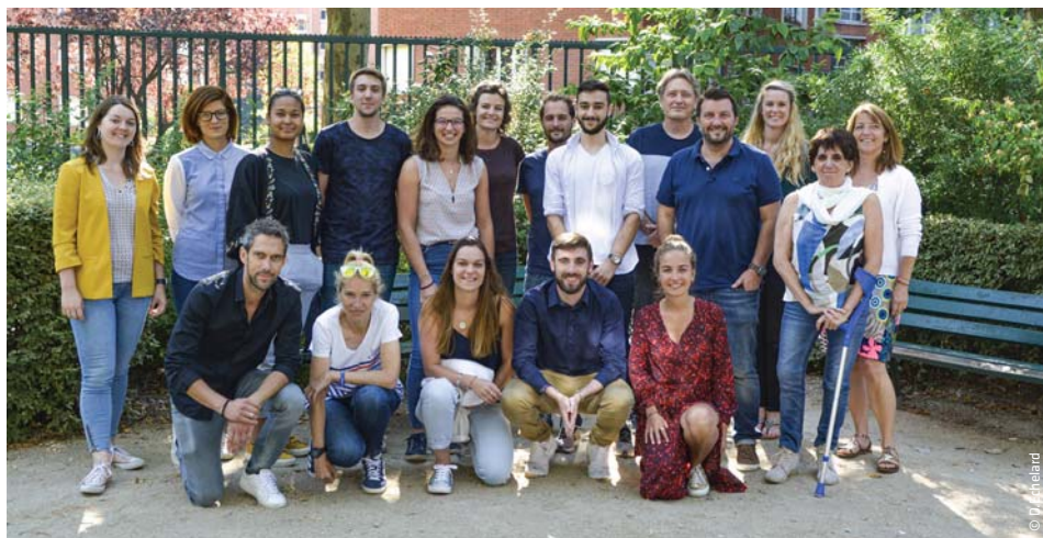
Handisport Open Paris : réunion du comité de pilotage au siège fédéral le 16 juillet, rendez-vous les 29 et 30 août au stade Charléty !