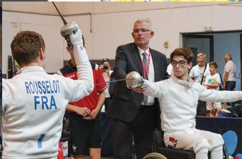
1. Championnat de France d'escrime handisport à Nîmes les 8 et 9 juin. Trois armes étaient réunies : sabres, fleuret, épée. Une belle compétition où se jouait en parallèle, un critérium national pour les déficients visuels et un championnats jeunes M15-M17. 2. Championnat de France de Tennis de Table, les 18 et 19 mai à Nîmes.