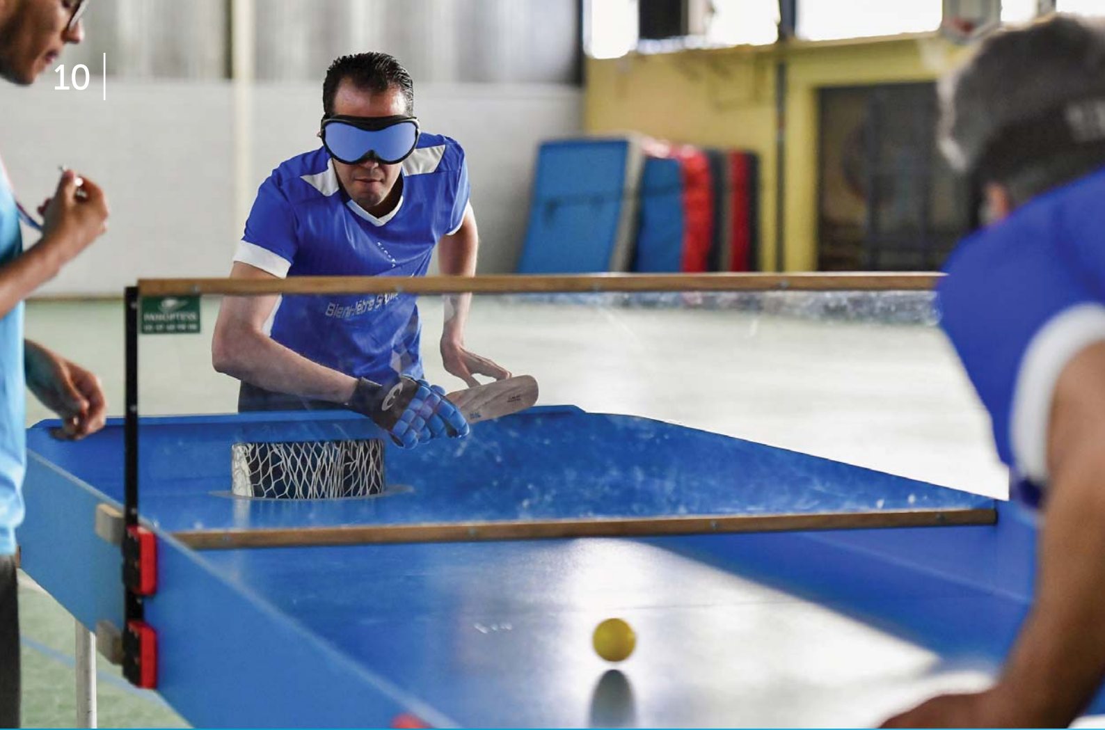
Le premier Open de Showdown, s'est tenu à Tours le 2 juin 2019. Un événement qui a permis de découvrir cette discipline dédiée au handicap visuel, et adaptée du tennis de table pour les mal voyants. Plus de 26 joueurs, venus de quatre clubs, se sont affrontés.